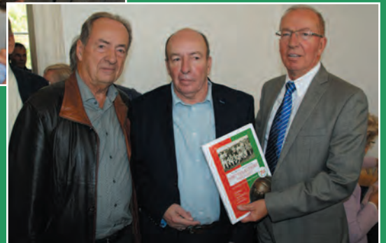
De '3 Van der Vekens' basisspelers van de Racing