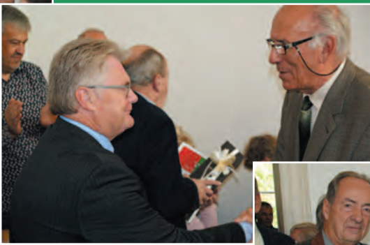
Felicities voor de auteurs