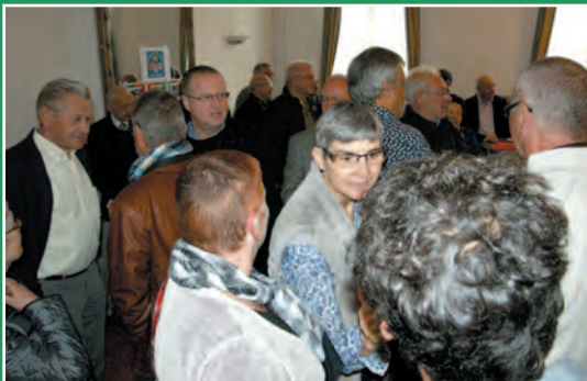
De auteurs: Alex Van der Veken en Marcel Baetens